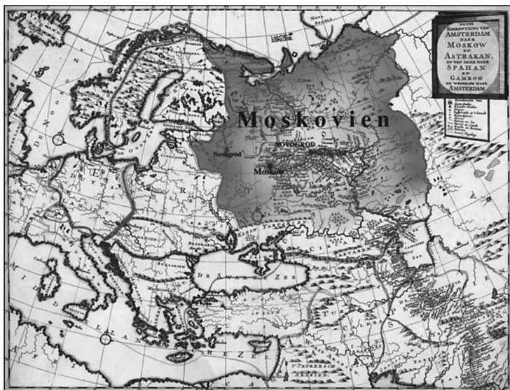
Голландская карта Московии XVIII в.

Вообще вплоть до последней четверти XVIII в. русские путешествия в Африку по-прежнему были связаны в основном с паломничеством, и личное знакомство наших соотечественников с этим континентом, по существу, ограничивалось знакомством с территорией Египта.