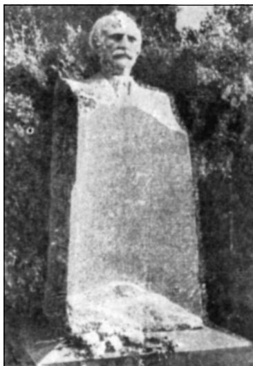
Памятник Дмитрию Гулия, народному поэту Абхазии, у Летнего театра в Сухуми

В знаменитой «Географии» Псевдо-Моисея Хоренаци (VII в.) говорится об истоках Нила, Аксумском царстве в Эфиопии, блеммиях Нубийской пустыни и о Восточном Су-