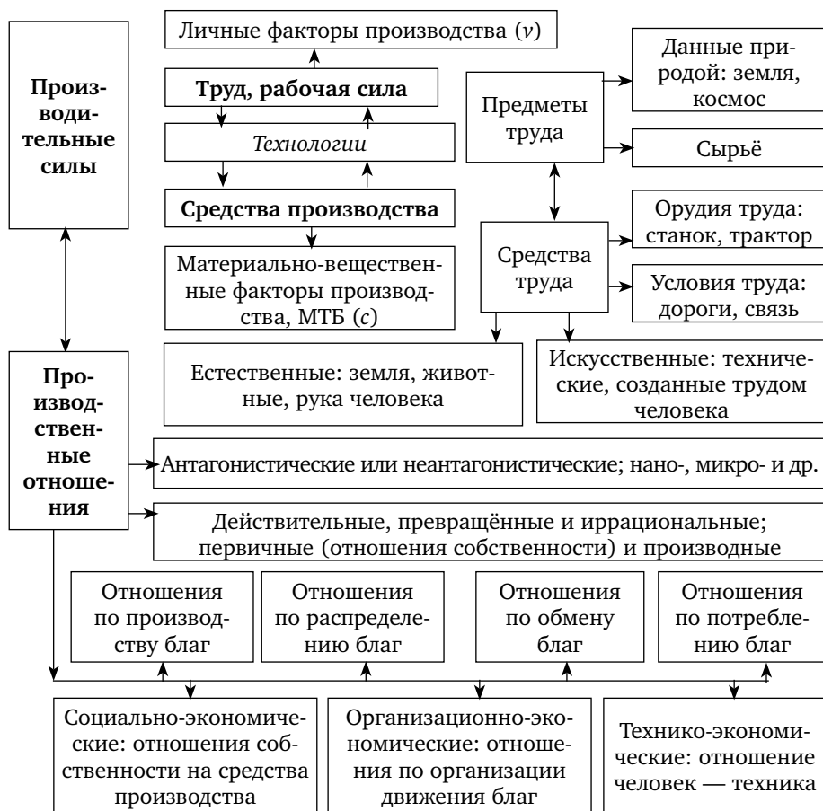
Рис. 1. Система производительных сил и производственных отношений

В секторальной структуре важно различать также финансовый сектор любого уровня экономики, где функционируют физические и юридические лица, основным видом деятельности которых являются финансы (банки, биржи, денежные фонды и пр.), и нефинансовый сектор экономики, где основным видом деятельности физических и юридических лиц финансы не являются (промышленные предприятия, строительство, домохозяйства и пр.).