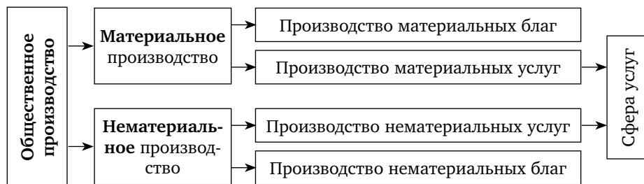
Рис. 3. Структура общественного производства

— нематериальное производство ( третичный сектор экономики), связанное с применением непроеводительного труда, его результатом являются нематериальные блага (духовные ценности, например информация) и нематериальные услуги (консультации). В ВВП США в нематериальном производстве занято более 75 % самодеятельного населения, в России — около 60 %.