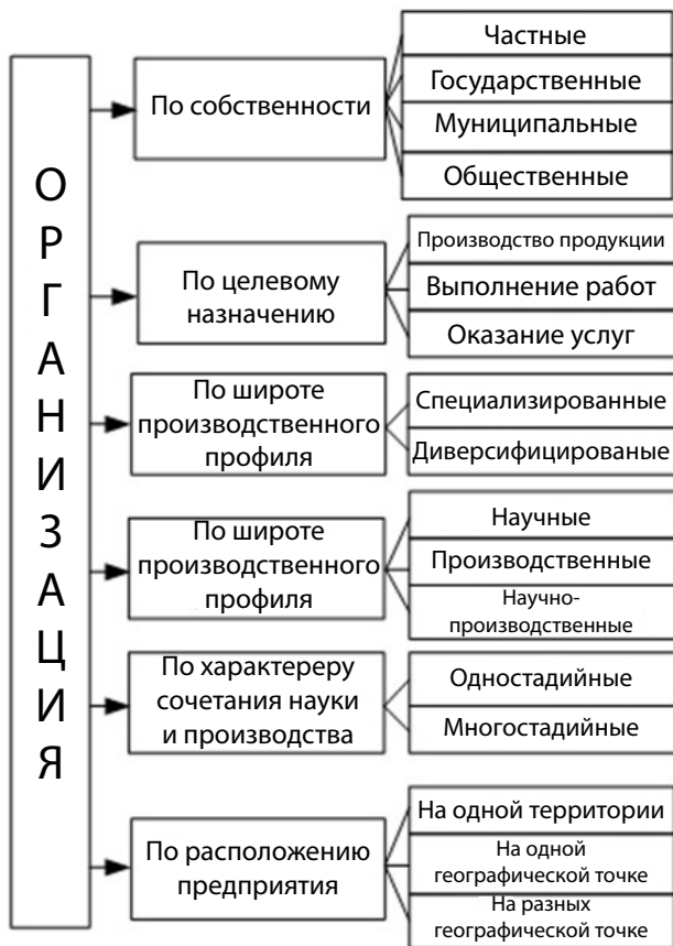
Рис. 1.2. Классификация организаций по ряду признаков

Юридическими лицами могут быть организации, преследующие извлечение прибыли в качестве основной цели своей деятельности (коммерческие организации) либо не имеющие извлечение прибыли в качестве такой цели и не распределяющие полученную прибыль между участниками (некоммерческие организации).