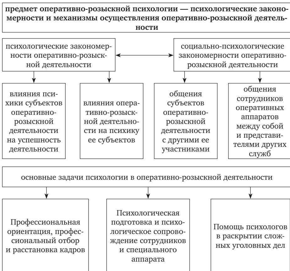
Рис. 1.1. Общая характеристика психологии оперативно-розыскной деятельности