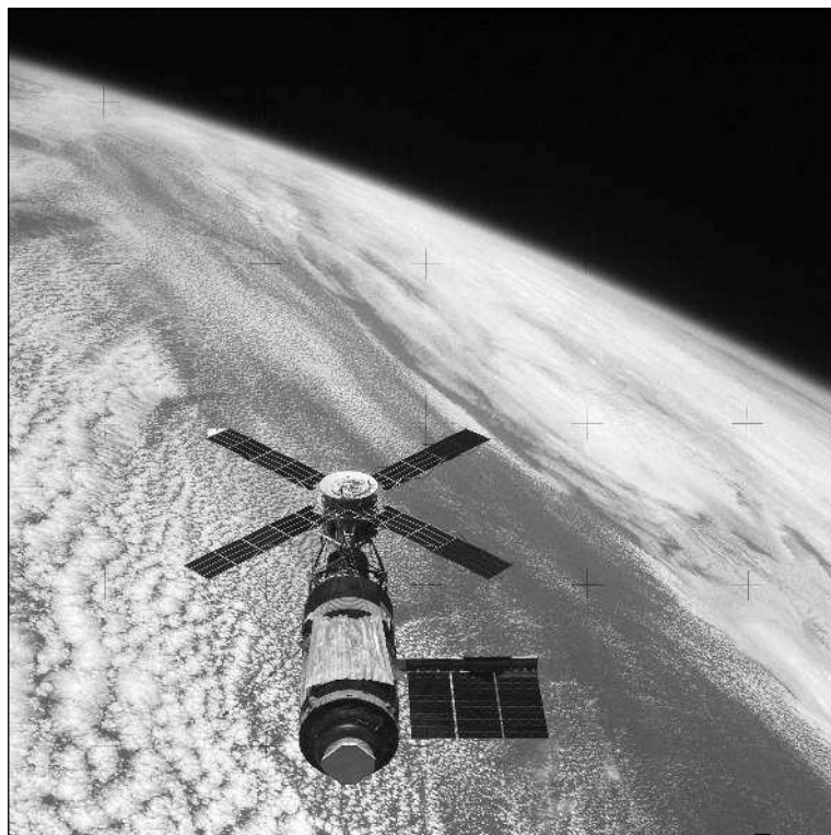
Орбитальная станция «Скайлэб».

Американская орбитальная станция «Скайлэб» была создана в 1960-х годах на волне всеобщего энтузиазма, связанного с пилотируемыми космическими полетами, особенно с лунными экспедициями «Аполлонов». Специалистам НАСА будущее представлялось эрой расцвета космических исследований. Предполагалось, что освоение космоса станет одной из основных задач в области науки и техники и что для этого будут выделяться большие финансовые средства. Поэтому были начаты се-