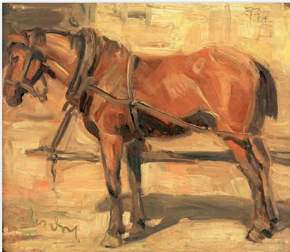
Франц Марк ЭТЮД С ЛОШАДЬЮ, 1905 Масло, картон

В 1905 году Франц Марк написал маслом на картоне небольшой этюд с лошастью. Уверенными мазками коричневых тонов он передал игру света и теней на теле животного. Этот этюд с натуры полностью соответствует тогдашним традициям живописи. Цветовые нюансы создают гармонию. В картине нет кричащих тонов и чистых цветов типа красного, синего и желтого. В живописи такого рода яркие цветовые контрасты не играют решающей роли. Эта работа недалеко ушла от рисунка, раскрашенного цветными карандашами, но ее цветовая непритязательность весьма необычна на фоне более поздних работ Франца Марка, для которых характерна яркость красок.