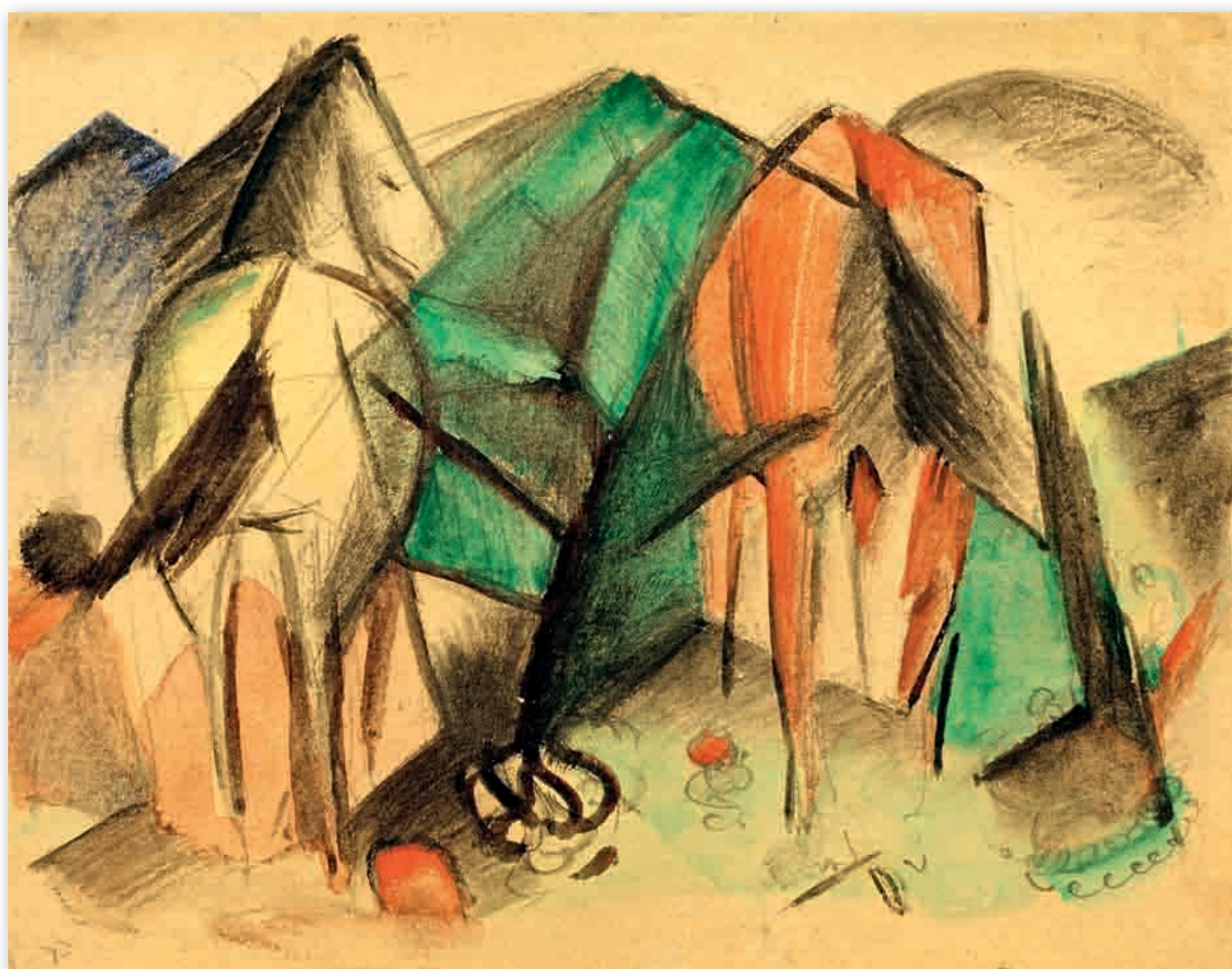
Франц Марк ДВЕ ЛОШАДИ, 1912/13 Смешанная техника 13 × 16,5 см Из альбома для этюдов XXVIII, частное собрание

иметь даже отрывочные дневниковые записи. Быстрые и мимолетные штрихи наглядно символизируют перемены. Ломаные очертания лошадей сливаются с ландшафтом. Формы перетекают друг в друга. Животные выделяются на фоне окружения только цветом. Мотив и задний план создают неразрывную композицию. Выразительная сила рисунка заключается в абстракции.