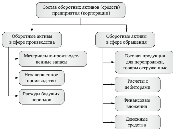
Рис. 1.2. Состав оборотных средств предприятия

Состав оборотных активов — это совокупность образующих их элементов (рис. 1.2).