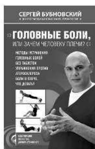
ГОЛОВНЫЕ БОЛИ, ИЛИ ЗАЧЕМ ЧЕЛОВЕКУ ПЛЕЧИ?