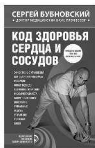
КОД ЗДОРОВЬЯ СЕРДЦА И СОСУДОВ