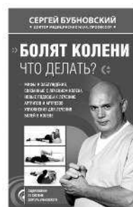
БОЛЯТ КОЛЕНИ. ЧТО ДЕЛАТЬ?