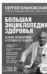
БОЛЬШАЯ ЭНЦИКЛОПЕДИЯ ЗДОРОВЬЯ ЛЕЧЕНИЕ ПОЗВОНОЧНИКА И СУСТАВОВ БЕЗ ЛЕКАРСТВ