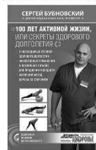
100 ЛЕТ АКТИВНОЙ ЖИЗНИ, ИЛИ СЕКРЕТЫ ЗДОРОВОГО ДОЛГОЛЕТИЯ