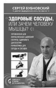
ЗДОРОВЫЕ СОСУДЫ, ИЛИ ЗАЧЕМ ЧЕЛОВЕКУ МЫШЦЫ?