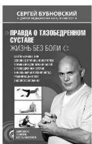
ПРАВДА О ТАЗОБЕДРЕННОМ СУСТАВЕ: ЖИЗНЬ БЕЗ БОЛИ