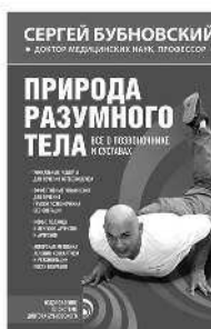
ПРИРОДА РАЗУМНОГО ТЕЛА. ВСЕ О ПОЗВОНОЧНИКЕ И СУСТАВАХ