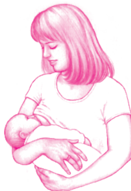
Грудное вскармливание приносит огромную пользу детям и матерям

Отцы обычно говорят: «Мы будем кормить грудью». Грудное вскармливание действительно является делом всей семьи. Из виденных нами матерей и малышей успешнее всего грудное вскармливание удается тем, у кого есть надежный муж и отец. Положительное влияние грудного вскармливания на здоровье и развитие ребенка огромно, но что еще не оценено должным образом, так это невероятный эффект, оказываемый грудным вскармливанием на мать. Вот что вы найдете в нем для себя: каждый раз, когда вы кормите своего ребенка, гормоны (пролактин и окситоцин) поступают в вашу систему кровообращения. Эти гормоны «кормилицы» способствуют формированию химической основы того, что называют