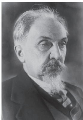
Л. В. Щерба

По словам Л. В. Щербы, это стихотворение «всё построено на антитезе, — приём, конечно, не выдуманный Брюсовым, но усвоенный им из мировой поэтической традиции, — это своего рода «грамматика поэзии» (я мужественно решаюсь на святотатственное соединение этих двух терминов, так как твёрдо убеждён, что когда наши поэты и литературоведы поймут, что такое настоящая грамматика, то вполне согласятся со мной)».