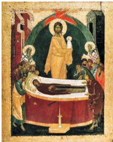
Икона «Успение Богородицы»

Донской монастырь. В 1598 году этой иконой был благословлен на царство Борис Годунов. В 1687 году она сопровождала русскую армию в Крымском походе князя Василия Голицына. После этого икона долгое время находилась в Благовещенском соборе. В 1919 году она была отреставрирована и перенесена в Государственный исторический музей, в 1930 году поступила в Третьяковскую галерею.