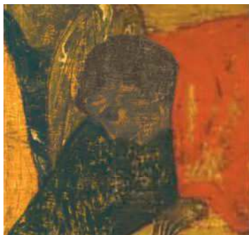
Предполагаемый автопортрет Рублева на иконе «Тайная вечеря» Благовещенского собора Московского Кремля

ных итальянских мастеров — настолько яркой и красивой оказалась древняя икона. Позже выдвигались теории, что на творчество Рублева повлияли итальянские мастера. Однако многочисленные исследования позволяют утверждать, что иконописец не был знаком с итальянским искусством и, следовательно, не мог из него ничего заимствовать. Образцом для него служила византийская живопись, а вдохновлял собственный гений.