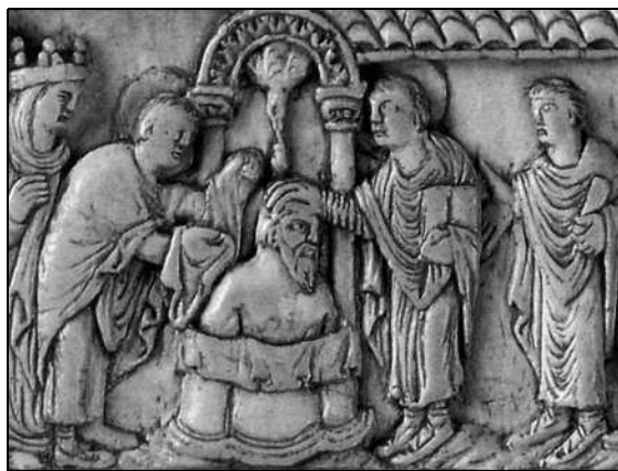
Крещение Хлодвига. Средневековый рельеф

М 5. Прочитайте текст и подчеркните ошибки. Ниже напишите правильный вариант.