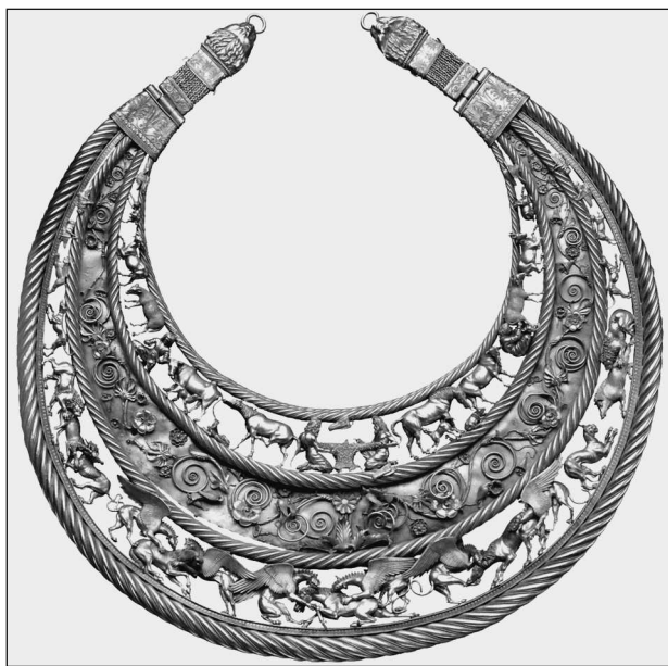
Золотая пектораль из кургана Толстая Могила

Скифы — одна из малых веточек на могучем древе индоевропейских народов, к которым относятся, помимо индоиранцев, славяне, балты, германцы, романцы, кельты, греки, армяне,