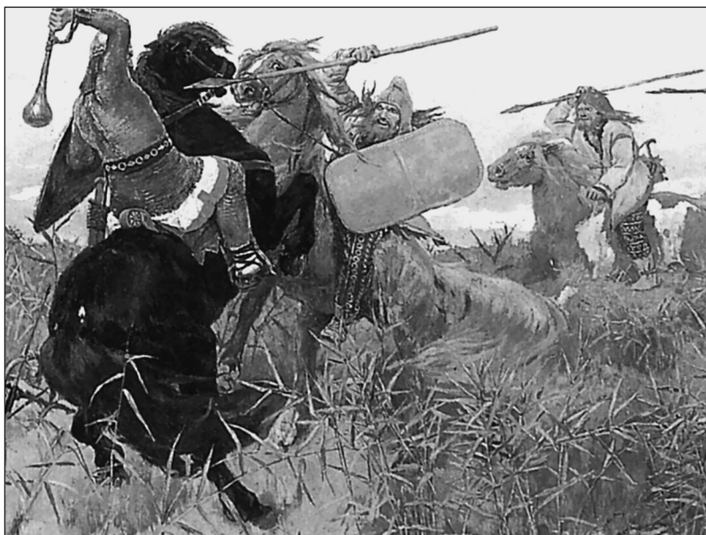
Бой скифов со славянами. Художник В.М. Васнецов

ское — сокрушило скифский «заслон», и оно-то как раз позднее обрушилось, пусть не всей мощью, на рубежи античной цивилизации.