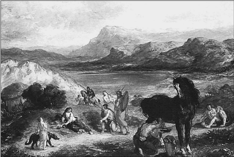
Овидий у скифов. Художник Ф.-В.-Э. Делакруа

Об истории скифов, — хотя известного людям Античности, но всё же «варварского» с их точки зрения народа на самых краях Ойкумены, — мы знаем в конечном счёте не очень много. В нашей работе мы попытались собрать максимально подробную информацию. Нас занимали как бурные